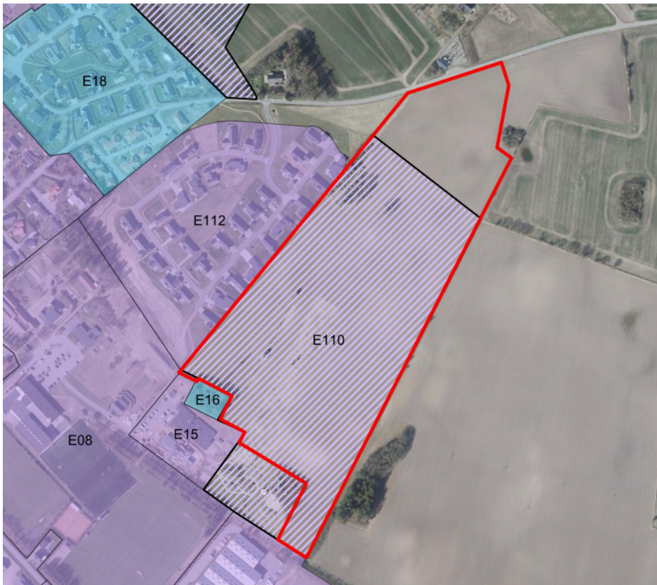
Figur 1 der viser de eksisterende forhold som det fremgår i Horsens Kommunes Spildevandsplan 2012 - 2015.